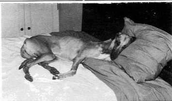
Après l'effort, la princesse au lit !

Chez le sloughi, lévrier arabe, la différence réside principalement dans l'oreille qui, au lieu d'être rejetée en arrière, est plate et portée tombante sur les joues, un peu à la manière d'un braque, mais sans aucune lourdeur, et dont la texture doit être fine. Si ce point est le premier qui frappe l'observateur, un examen plus minutieux fait apparaître d'autres caractères bien propres à cette race : la tête en forme de coin, au crâne plutôt large entre les oreilles, les mâchoires extrêmement puissantes (le lévrier n'est pas sa seule proie : il chasse aussi la gazouille, le sanglier... voire le chacal !). Le corps du sloughi, qui pourrait presque s'inscrire dans un carré, est solide et musclé mais les masses musculaires, au lieu d'être saillantes, sont sèches, allongées et laissent apparaître la charpente osseuse. Les membres sont forts mais leurs rayons beaucoup moins obliques que ceux du Grey. L'épaule semble presque droite, la ligne de dos aussi ; la croupe, osseuse, tombe vers un fouet fin, qui, laissant deviner les vertèbres, s'amincit vers son extrémité en formant une boucle.