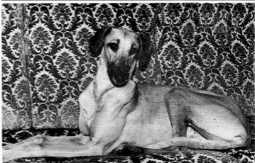
OUAFA' A KHALLOUL DE LA TREILLE (9 mois)

Prop. Mme Rogard. Préd. Mme Rohde-Goudineau